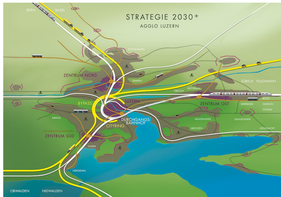
Abbildung 9: Gesamtstrategie Agglomeration Luzern 2030+

Die Agglomeration Luzern wird bezüglich Bevölkerung, Arbeitsplätzen / Beschäftigten , Bildung, Kultur und Freizeit usw. und damit auch bezüglich Verkehr weiter wachsen. Dementsprechend kommt der bestmöglichen Abstimmung von Siedlungs- und Verkehrsentwicklung grösste Bedeutung zu.