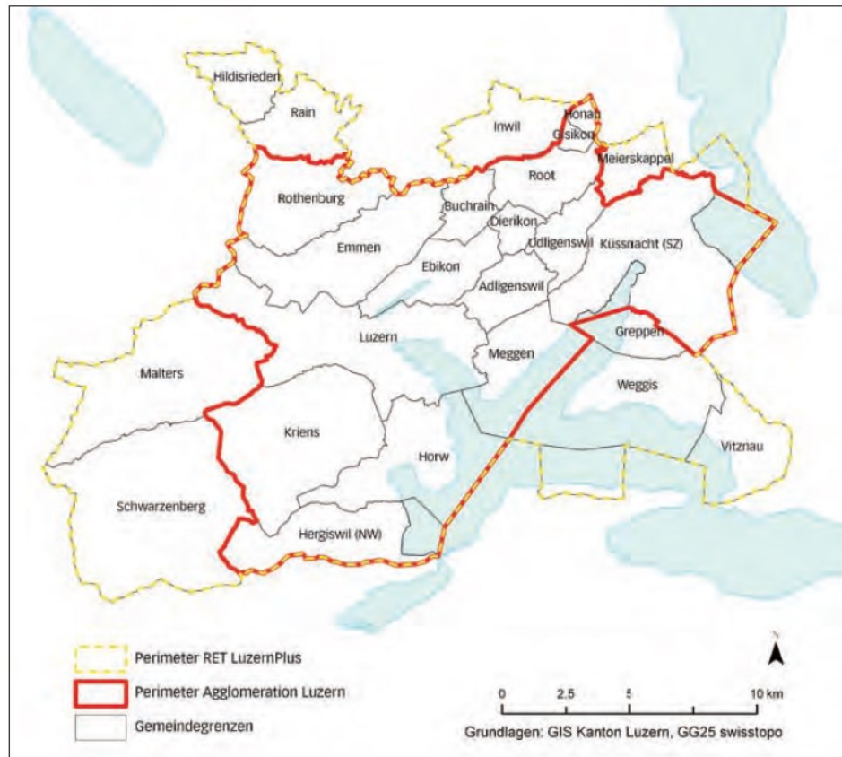
Abbildung 8: Perimeter Agglomerations- programm